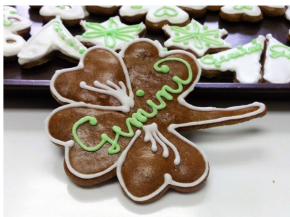
Obrázek 16,17,18 Práce žáků