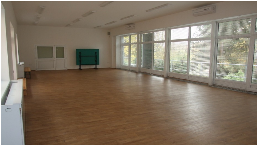
Obrázek 8 Víceúčelový sál