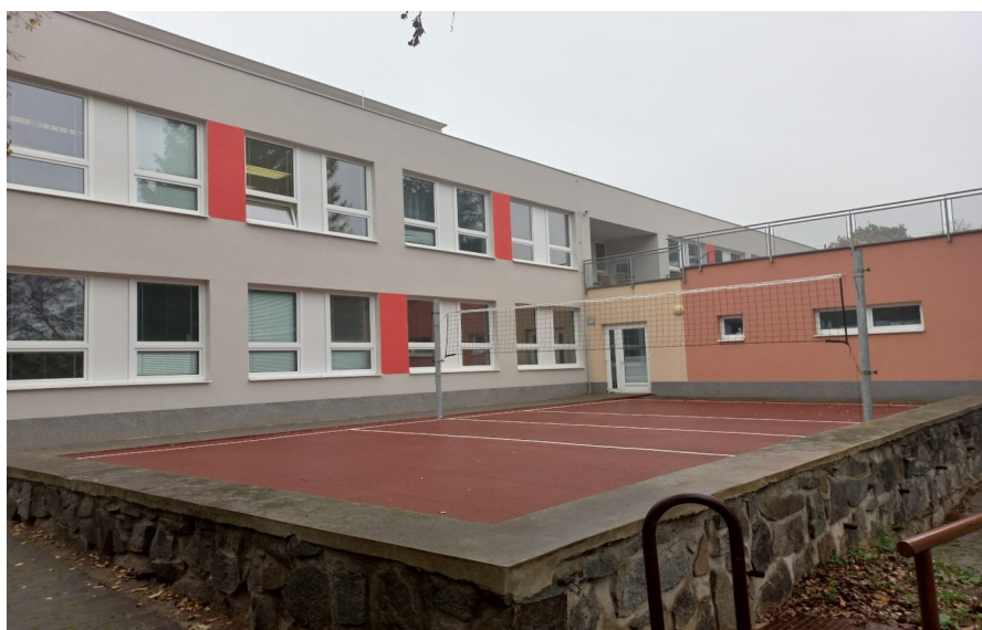
Obrázek 14 Hřiště