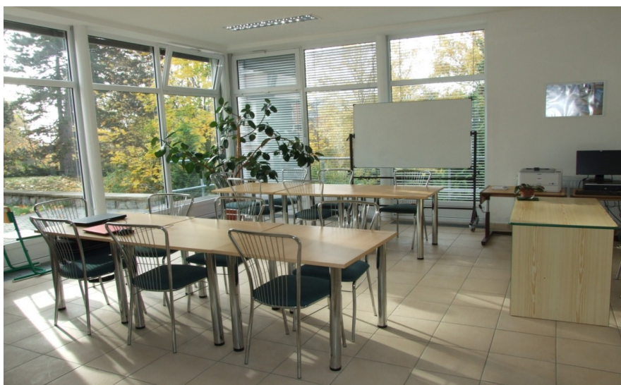
Obrázek 12 – Učebna „Kavárnička“