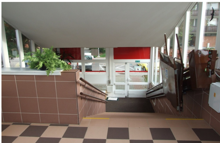
Obrázek 4 Schodiště s pojízdnou plošinou