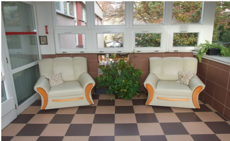
Obrázek 6 Chodba - odpočívadlo