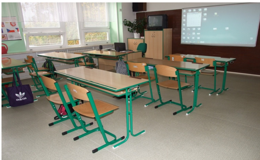
Obrázek 9 Učebna s interaktivní tabulí