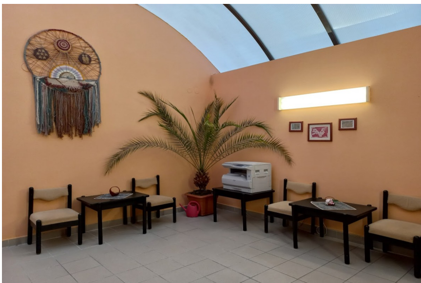
Obrázek 11 Odpočinková místnost