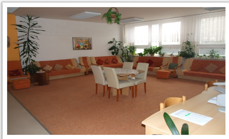
Obrázek 1 Společenská místnost - internát