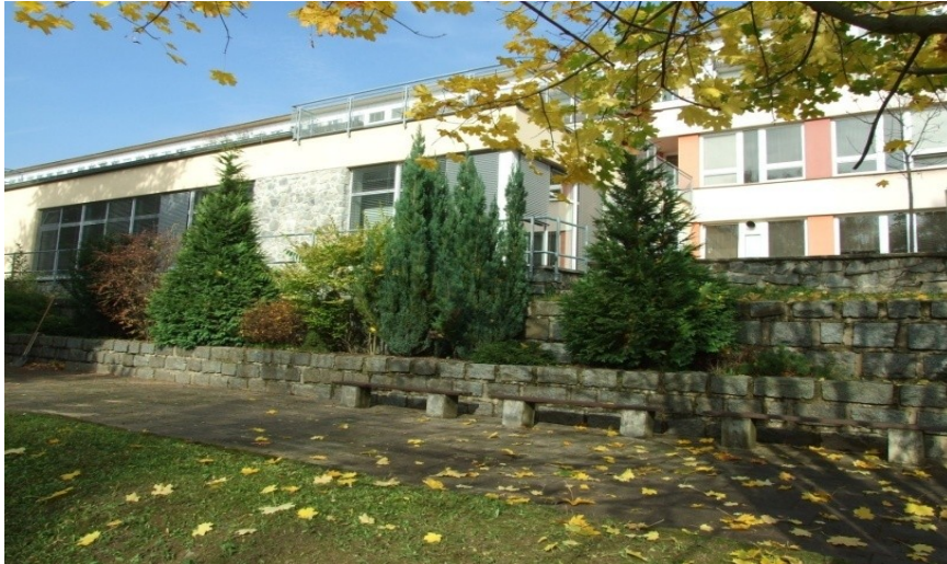
Obrázek 15 Budova školy - pohled ze zahrady