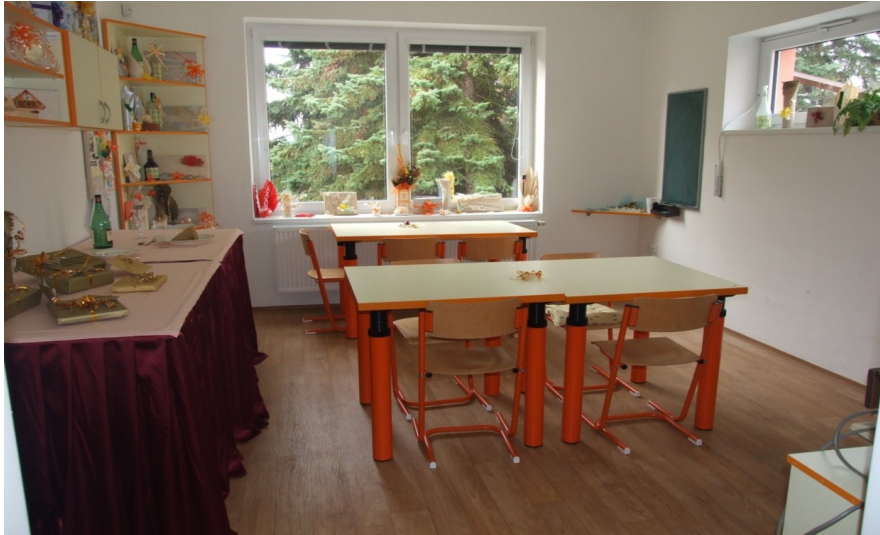
Obrázek 7 Odborná učebna „Prodejníčka“