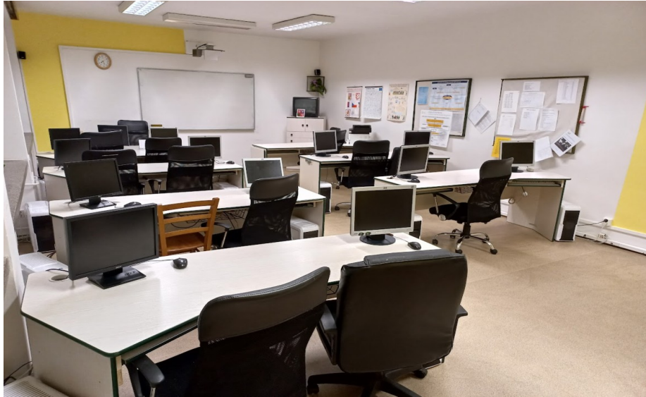
Obrázek 5 Odborná učebna výpočetní techniky