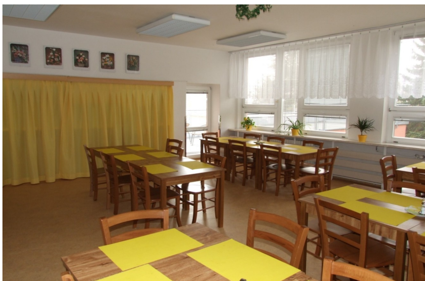
Obrázek 10 Jídelna