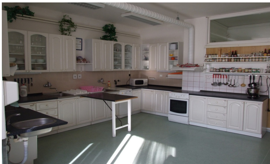
Obrázek 13 Odborná učebna „Kuchyňka“