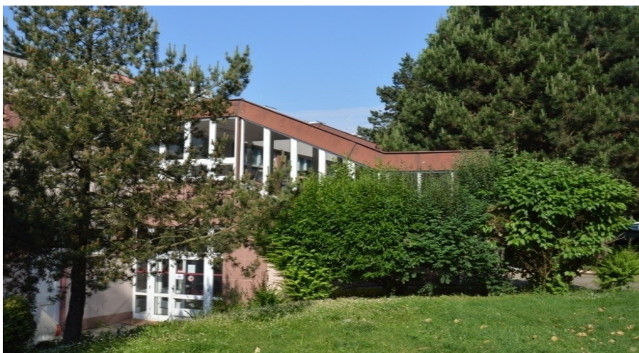
Obrázek 2 Škola, boční vchod